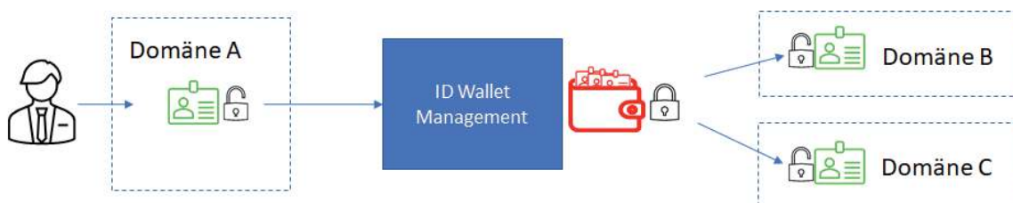
ABBILDUNG 2: Das ID Wallet Management symbolisiert die Wirkungsmechanismen, welche den Datenschutz beim organisationsübergreifenden Datentransfer sicherstellen. Eine Person wird in einer Domäne A identifiziert und mit einer lokal gültigen elektronischen ID (links). Im Zuge der Pseudonymisierung für eine andere Domäne (Domäne B oder C), generiert ein «ID Wallet Management» eine ID-Wallet. Diese ID-Wallet beinhaltet ein oder mehrere ID(s) aus unterschiedlichen Domänen in verschlüsselter Form. Das Wallet kann in die verschiedenen Domänen weitergegeben werden, jedoch kann eine Identität nur von der jeweiligen Domäne entschlüsselt werden.

Eine detaillierte Darstellung des tatsächlichen Identitätsmanagements ist für Nicht-Ingenieur*innen schwer verständlich. Aus Nutzer*innensicht kann man sich aber die Wirkung der technischen Protokolle als «ID Wallet Management» vorstellen, so wie es in Abbildung 2 dargestellt wird. Das technische System stellt sicher, dass Daten organisationsübergreifend so transferiert werden, dass sie nur in der berechtigten Domäne gelesen werden können. Dies auch dann möglich, wenn es sich nicht um staatliche, sondern um private Nutzungsdomänen handelt. 16